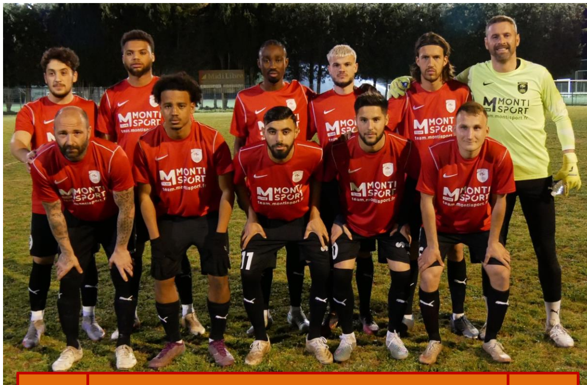
L'équipe d'AIGUES MORTES