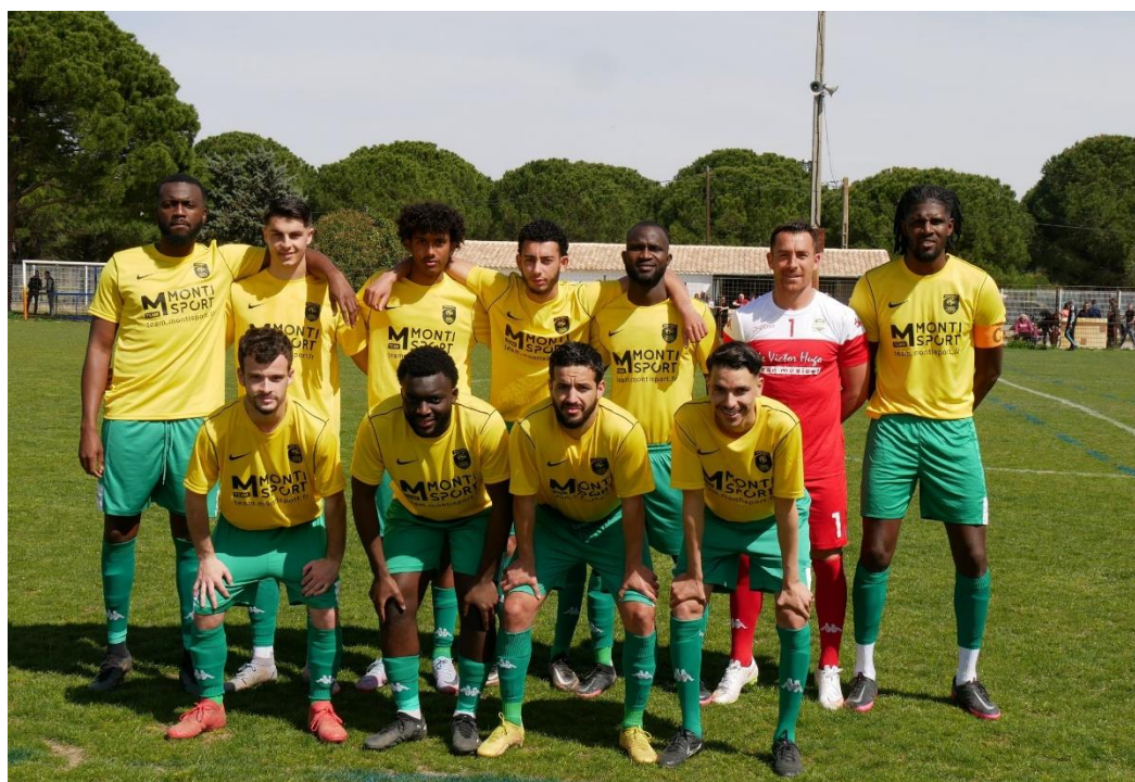
L'équipe d'UCHAUD GC

Il y a un an, c'est à Saint-Christol-les-Alès que s'était jouée la finale de la coupe Gard-Lozère. Elle avait opposé Pays d'Uzès, pensionnaire de R1, à Barjac, qui évoluait alors en D2. Malgré les quatre niveaux d'écart, les Ducaux avaient dû se contenter du minimum (1-0).