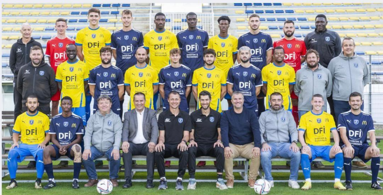
L'équipe première de Mende Avenir Foot Lozère qui joue dans le championnat de Régional 1.

Finir du mieux possible l'exercice, telle sera donc la mission de l'équipe première. Dans son opération maintien, la réserve, elle, composée de jeunes joueurs issus des équipes jeunes elle aussi performantes, recevra Fabrègues, ira à Rousson et recevra Pignat. Maintenir une seule division d'écart entre les deux équipes seniors, sûr que ça aurait de l'allure.