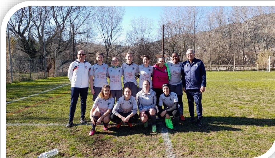
EQUIPE DE ENT CALVISSON VAUNAGE

Autant de bonnes raisons pour tenter d'inscrire son nom au palmarès. Pour arriver en finale, Monoblet a successivement éliminé Chusclan (4-3), Aimargues (1-3) et Anduze (0-2). Calvisson-Vaunage a sorti tour à tour Gallician (2-4) et All Five Académie (1-2).