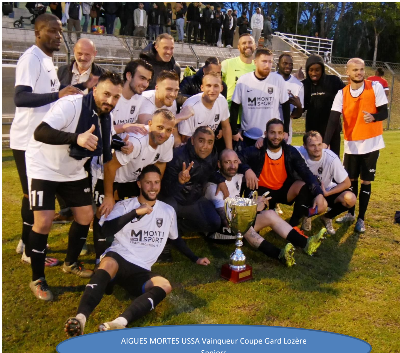
AIGUES MORTES USSA Vainqueur Coupe Gard Lozère Seniors