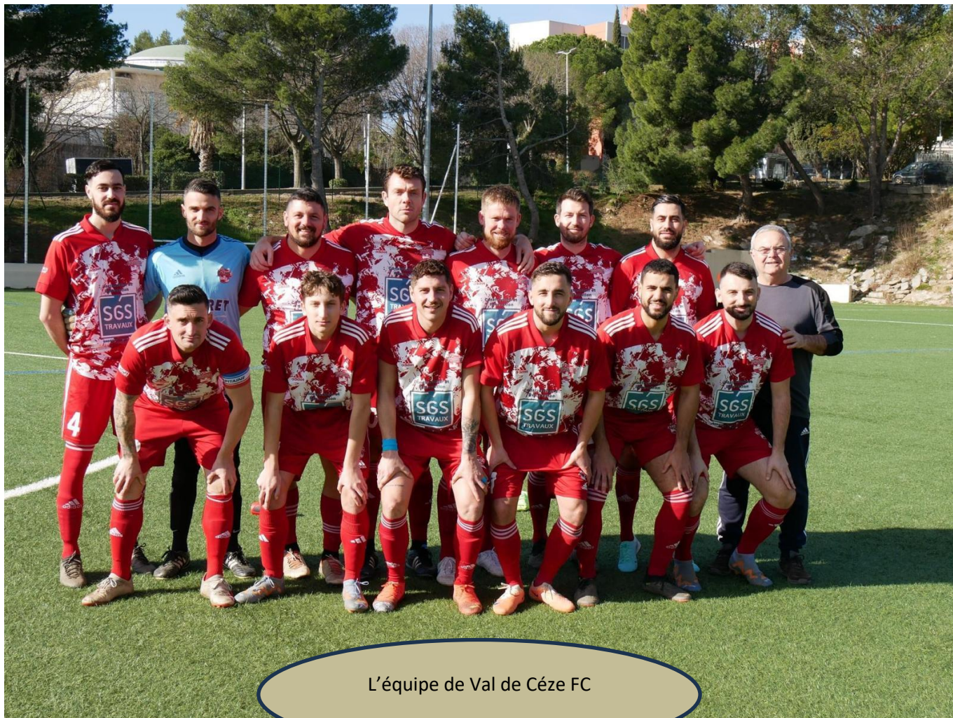
L'équipe de Val de Cèze FC