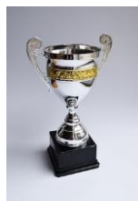
Coupe de France