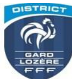
TABLEAU DES OBLIGATIONS DE DIPLOMES DES EDUCATEURS POUR LES PLUS HAUTS NIVEAUX DE COMPETITIONS DISTRICT